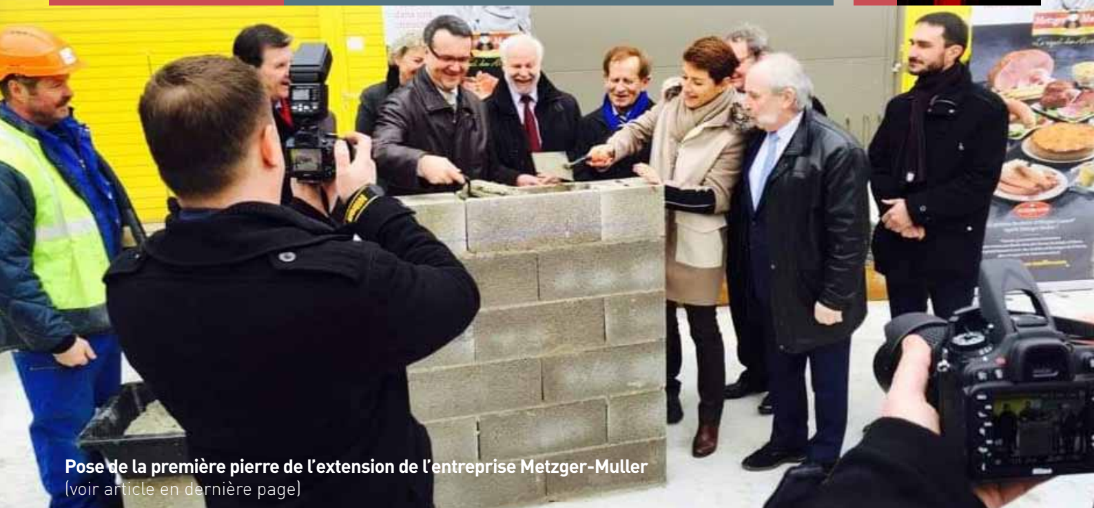
Pose de la première pierre de l'extension de l'entreprise Metzger-Muller (voir article en dernière page)